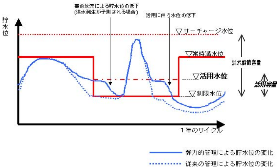
弾力的管理に伴う貯水位変化の模式図

ダムの弾力的管理とは、洪水調節に支障をきたさない範囲で、降水量の多い梅雨や台風シーズンに空容量となっている洪水調節容量の一部に流水を貯留し（活用容量）、これをフラッシュ放流、一定量放流等の有効活用を行い、ダム下流の河川環境の整備と保全に役立てるものです。