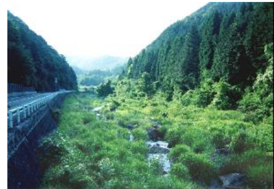
ダム建設前（イメージ）