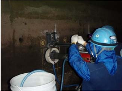
放水路暗渠コア採取状況