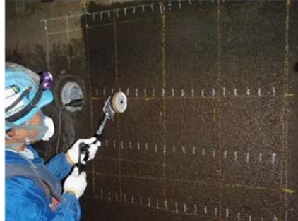
放水路暗渠自然電位測定状況