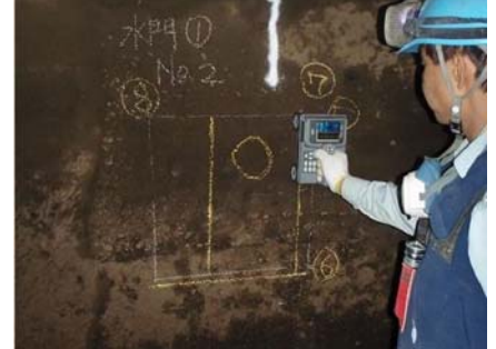
放水路暗渠鉄筋探査状況