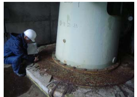
ポンプベースの目視点検状況