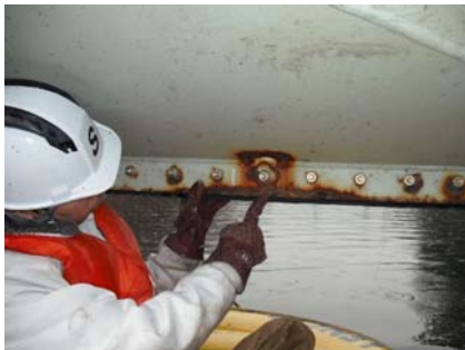
ゲート扉体の目視点検状況