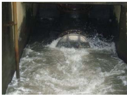
ポンプ運転点検状況