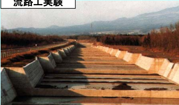
※「目で見える砂防水理模型実験」より (財)砂防・地すべり技術センター発行

流路工は、荒廃溪流の流路の侵食を防ぎ、通水断面を確保して、洪水や土砂の氾濫を防止することを目的とする構造物です。